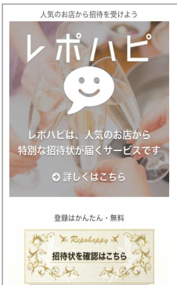
スマホ版サイトトップ