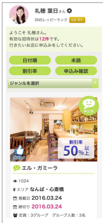
招待状（会員マイページ）