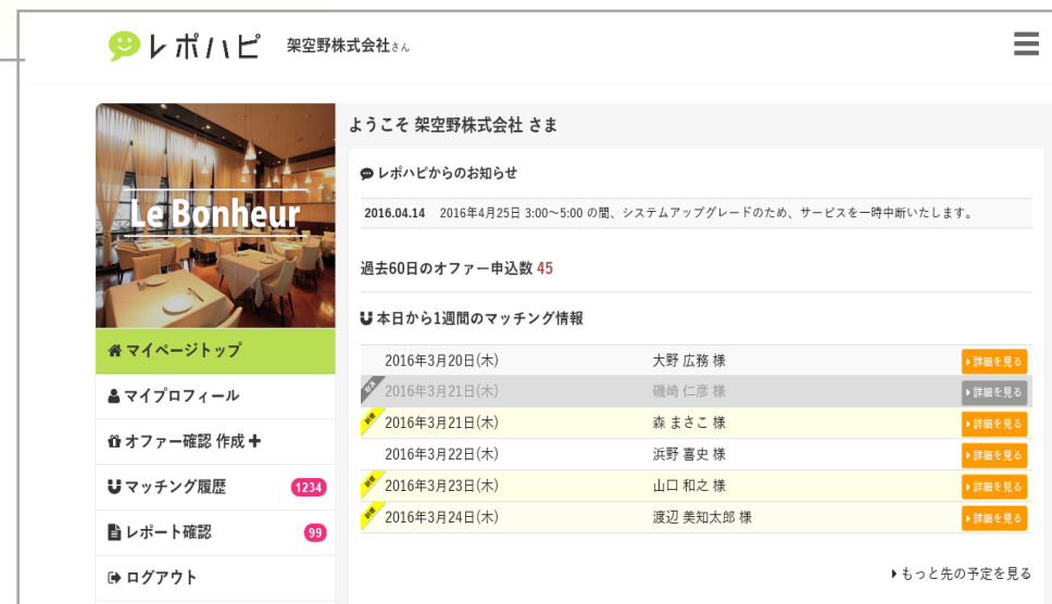
招待申込み状況 (ショップ・企業マイページ)